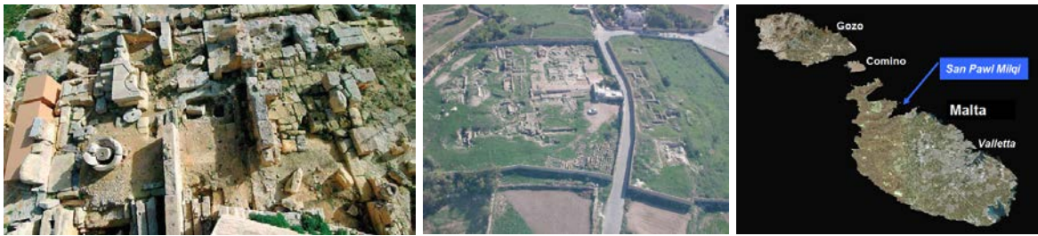
San Pawl Milqi, Malta

La strana conclusione del libro lucano di Atti , che non narra l'esito dell'appello di Paolo a Cesare, può essere spiegata in vari modi. Forse ci fu un esito negativo del processo con una condanna a morte di Paolo. Forse Luca aveva intenzione di scrivere un terzo libro (aveva già scritto il suo Vangelo e Atti ) narrando gli eventi posteriori con la liberazione di Paolo e il suo rientro. Quest'ultima soluzione pare la più probabile perché spiegherebbe il silenzio lucano per ragioni artistiche: avrebbe mostrato il progressivo sviluppo del vangelo da Gerusalemme agli estremi confini del mondo allora conosciuto, arrestandosi alla capitale dell'impero, estremo limite della predicazione apostolica.