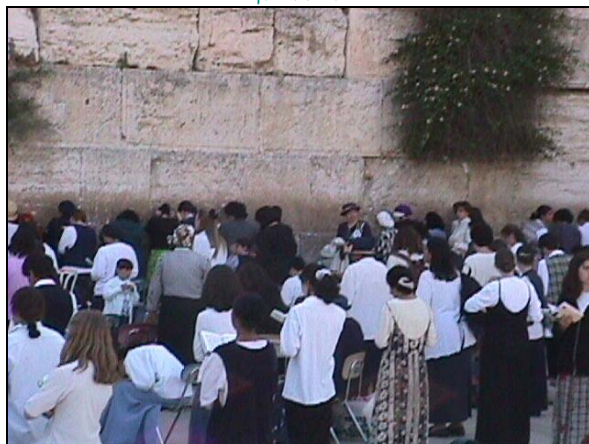
Secondo dei tre pellegrinaggi