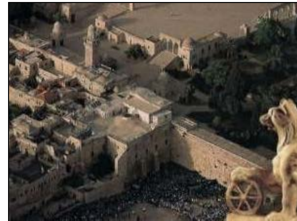
Primo dei tre pellegrinaggi (Es 23:14-17)