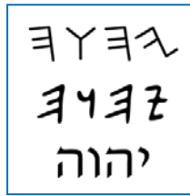
Il tetragramma nella sua evoluzione dall'antico alfabeto all'ebraico attuale

questa vocalizzazione la frase significa: “Questo è il mio nome perché sia nascosto ”. Questo significato appare in perfetta armonia con il contesto. A Mosè che vuole scoprire il nome divino (il più importante che possa esistere nell’universo visibile e invisibile), Dio ribadisce che il suo nome deve rimanere quello con cui Israele lo ha sempre conosciuto: Yhvh, “Colui che è”. E aggiunge che quello è il suo nome, “ perché sia nascosto ”. Così, quello nascosto, che Mosè avrebbe voluto conoscere, rimane nascosto.