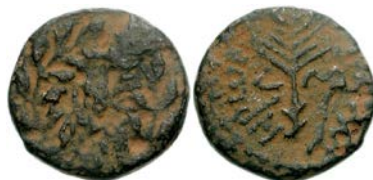
Moneta di Erode Antipa

a Roma, resistette a tale pressione. Ma Erodiade “quanto più lo vedeva opporsi alle sue aspirazioni e al viaggio, tanto più si sforzava di persuaderlo a tentare ogni cosa pur di ottenere il titolo di re. E non cessò se non quando riuscì a carpirgli il consenso. Ed egli fu costretto a cedere alla sua insistenza” ( Ibidem ). L’impresa fallì miseramente. Su sollecitazione di Agrippa fu accusato di lavorare contro Roma; gli furono trovate armi per settemila uomini. Così, verso il 40 E. V., Antipa fu esiliato in Gallia (odierna Francia), dove Erodiade lo volle seguire rifiutando il favore imperiale a suo riguardo. “Tu, o Cesare, parli da quel generoso e grand’uomo che sei, ma l’amore che porto a mio marito mi vieta di accettare i tuoi doni cortesi. E poiché fui compagna nella prosperità non è giusto da parte mia che l’abbandoni nelle sue sventure”. - Ibidem 18,7,2.