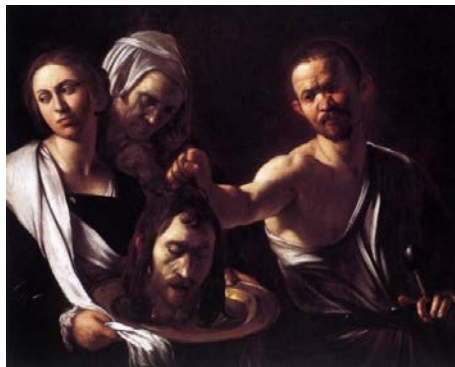
Caravaggio, Salomè con la testa di S. Giovanni Battista , 1609.