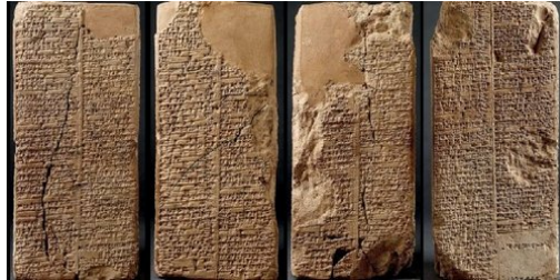
Tavolette dell' Enūma eliš , British Museum, London, Regno Unito

Nell' Enūma eliš si ha nella quarta tavoletta la svolta decisiva per la costituzione del mondo; nel racconto biblico è proprio nel quarto giorno che vengono posti nel cielo il sole, la luna e le stelle. Ciò è decisivo per il calendario e, guarda caso, l' Enūma eliš era solennemente recitato nel quarto giorno nel rito primaverile babilonese di akitu con cui si festeggiava per una settimana l'arrivo del nuovo anno 2 .