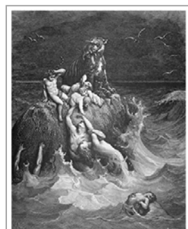
Incisione di Gustave Doré