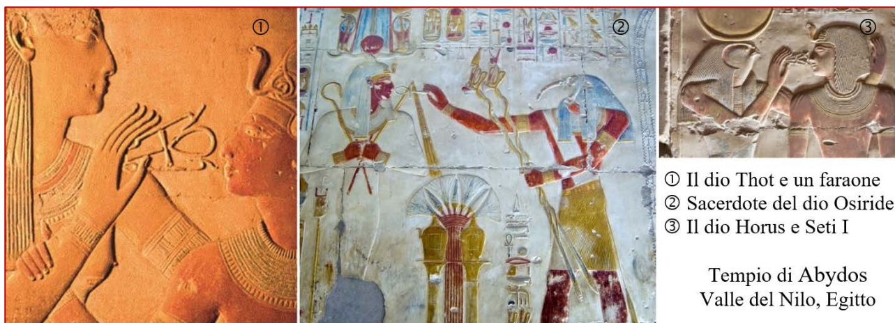
Il “segno della vita” viene accostato alle narici del sovrano

L'idea che il soffio vitale derivasse da una divinità era molto diffusa nell'Oriente antico e la Bibbia se ne serve, con molta sobrietà, in Gn 2:7. Tale idea era accolta anche in Egitto, come mostrano le seguenti immagini: