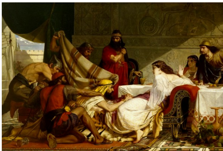
Il banchetto di Ester , di Edward Armitage (1817 - 1896), pittore inglese; olio su tela, 1200 x 1830 mm; British Museum, London (Regno Unito).

Tutta la sua storia, magnificamente scritta nella Bibbia nel libro che porta il suo stesso nome, illustra a quali imprese può arrivare l'intelligenza di una donna guidata dal sentimento. E, nel contempo, spiega come la logica femminile della vita può arrivare ad una concezione elevata della vita stessa. E gli uomini, se vogliono trarne una lezione, non devono temere l'intelligenza di una donna, ma casomai ammirarla.